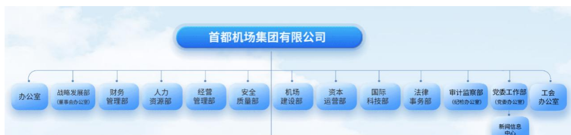
图5-3：首都机场集团有限公司内部机构设置图