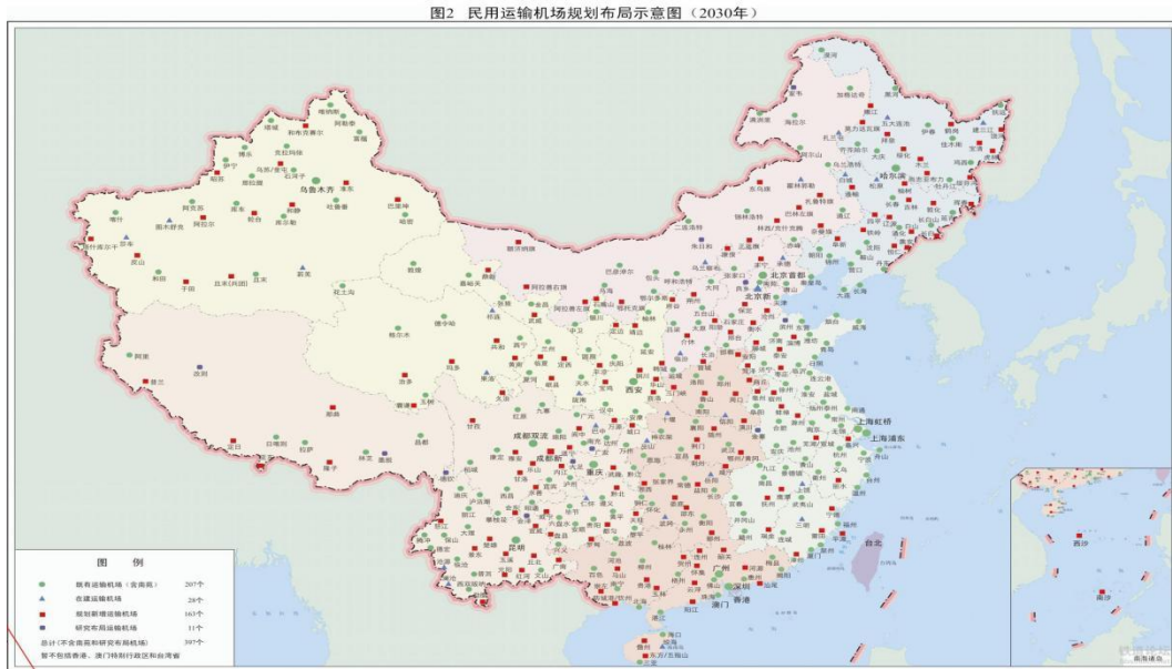
图 5-25：全国民用机场布局分布图（2030 年）

到 2030 年，全国民用机场布局规划分布情况见图 5-26《全国民用机场布局规划分布图》。