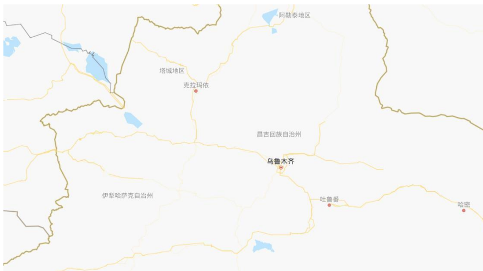
图表 5-37：伊犁哈萨克自治州区位图

2025 年，伊犁哈萨克自治州全年实现地区生产总值（GDP）3,470.95 亿元。其