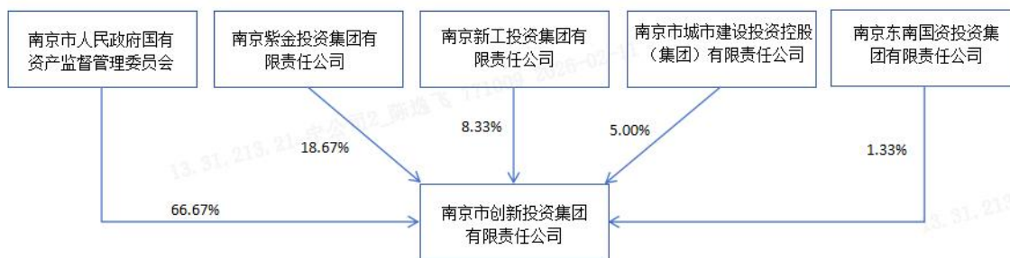
表5-4-2：发行人股权结构图