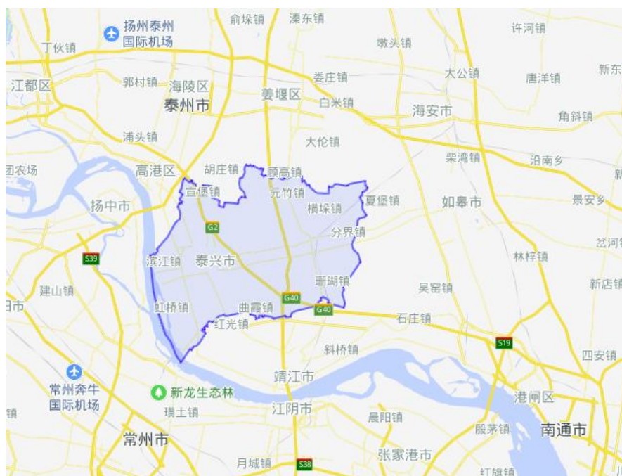
图表 5-22：泰兴市区位图

根据《2025 年泰兴市政府工作报告》，2025 年泰兴市经济社会发展的主要预期目标为地区生产总值同比增长 6.0% 左右，固定资产投资增长 5.0% 左右，社会消费品零售总额增长 6.5%。