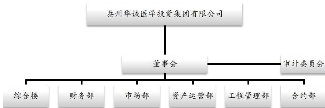
图表5-9：公司组织结构图

公司依据《公司法》等法律法规和规范性文件的要求，建立并完善了内部结构。公司内部机制运作规范，组织机构健全、清晰，其设置体现了分工明确、相互制约的治理原则。公司副总理由董事会聘任，严格实施股东会决议并贯彻落实董事会决议。公司设立了综合部、财务部、市场部、资产运营部、工程管理部、合约部六大部门，具体执行副总经理下达的任务。