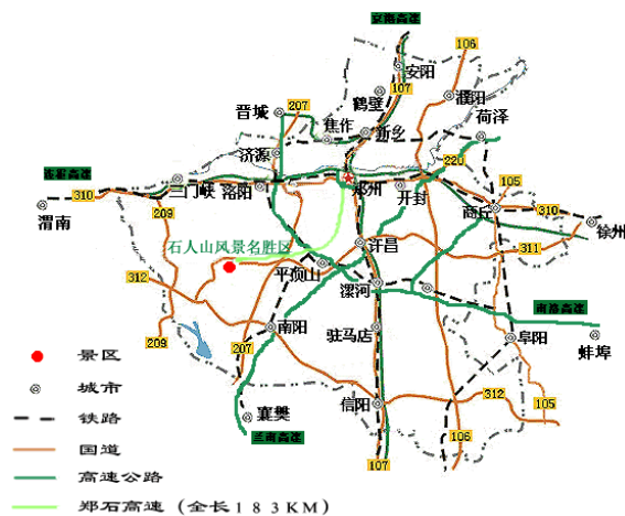
图 2：公司现有路产竞争示意图

公司的路网分流主要来自两个方面：铁路竞争和公路竞争，公司现有路产和规划中项目存在部分平行线路和复合线路，未来公司的竞争压力将逐步加大。